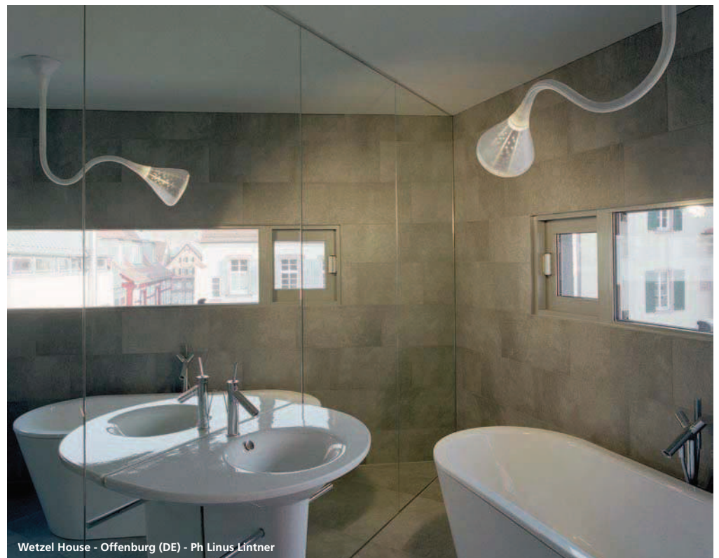
Wetzel House - Offenburg (DE)