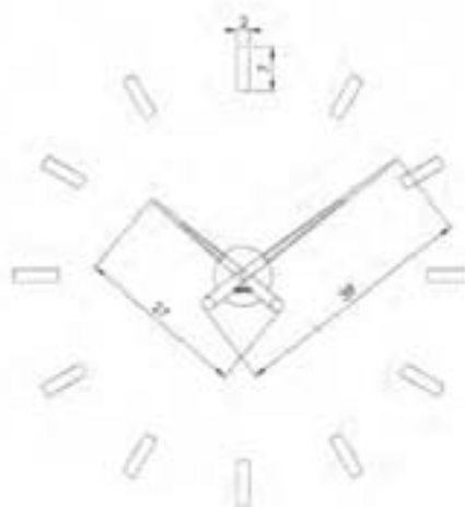
tacón 12 i