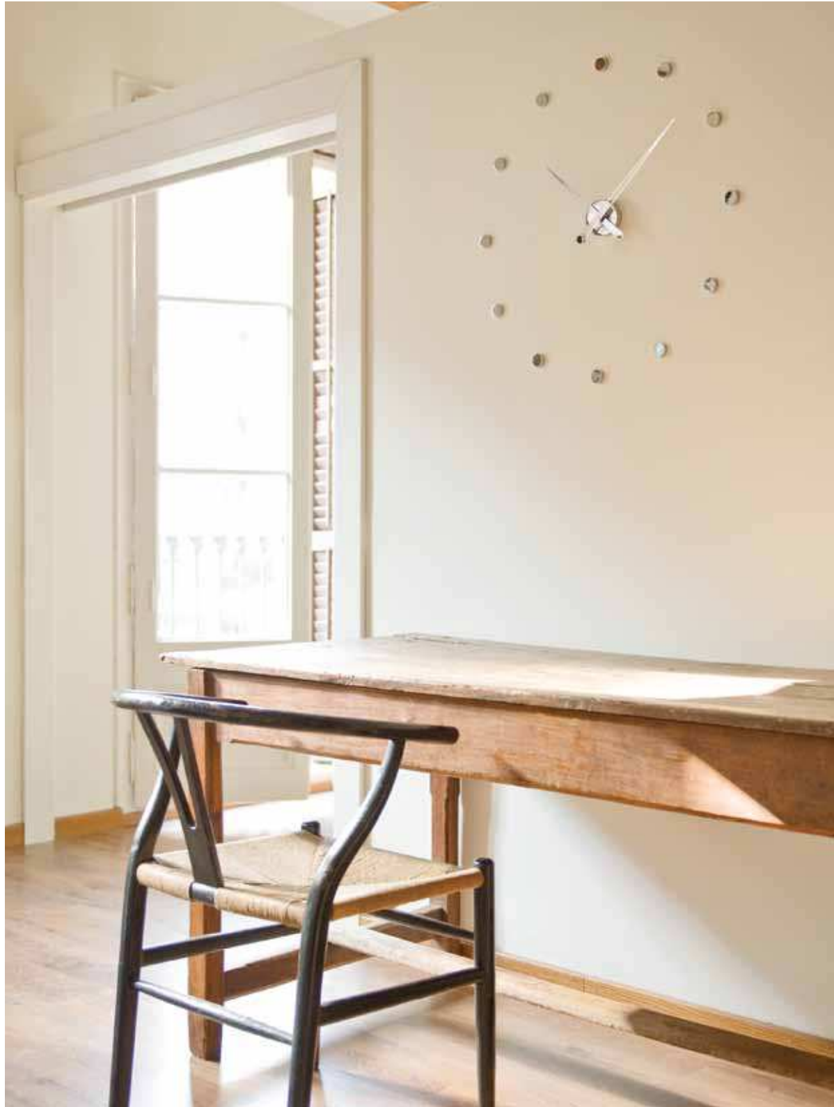
rodón 12 i