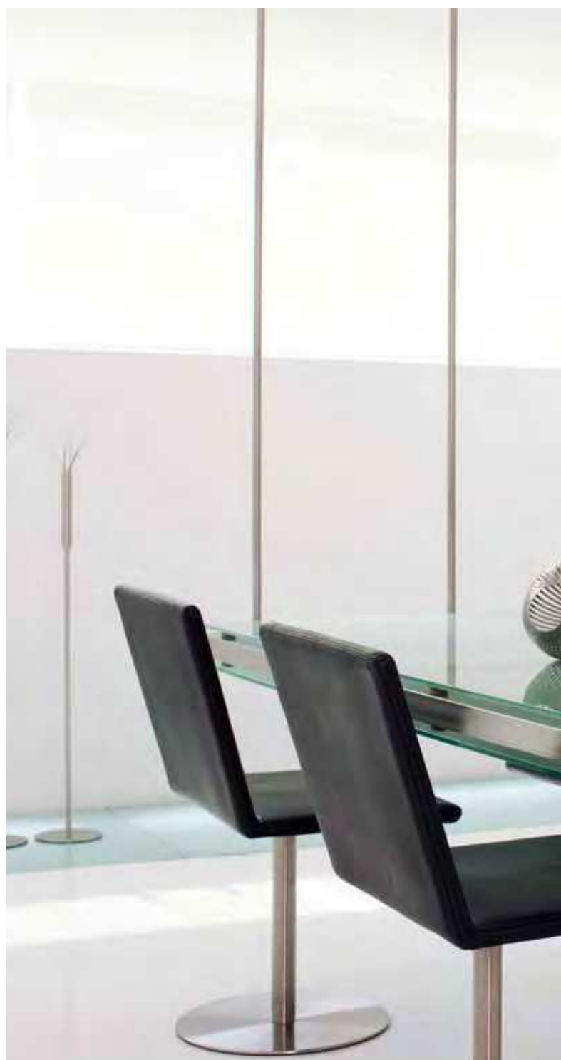
merlín 12 n