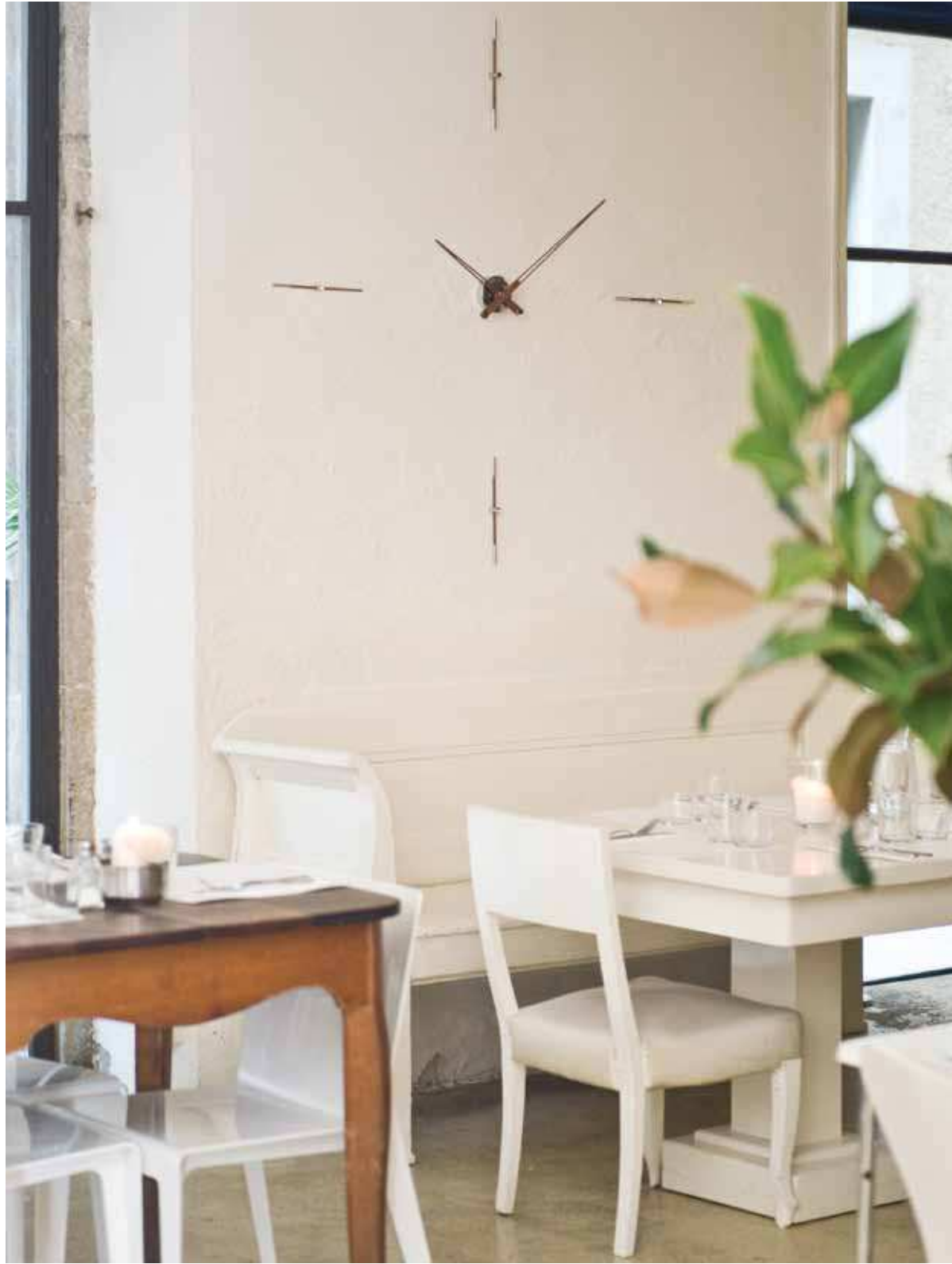
merlín 4 n