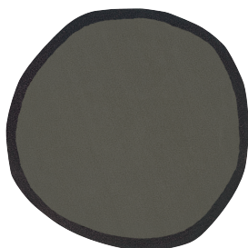
Aros redonda 2