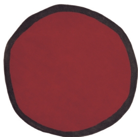
Aros redonda 1