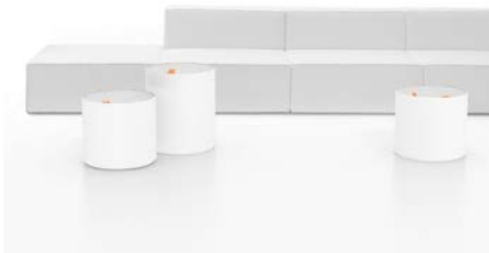
UP IN THE AIR mesa