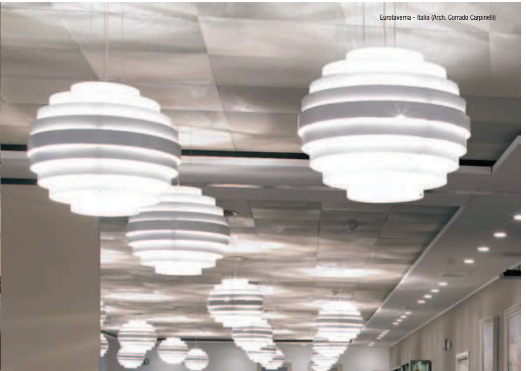
Eurotaverna - Italia (Arch. Corrado Carpinelli)