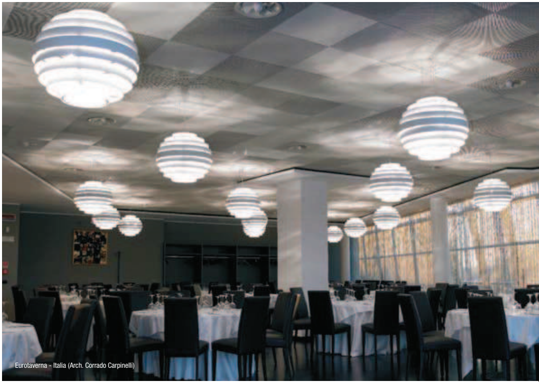
Eurotaverna - Italia (Arch. Corrado Carpinelli)