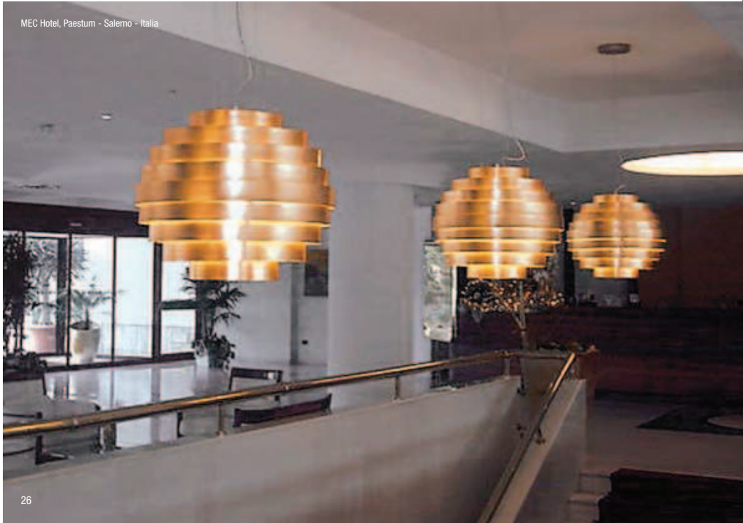
MEC Hotel, Paestum - Salerno - Italia