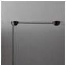
AGGREGATO SOSP ROSONE DECENT A086000