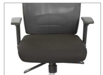
Mecanismo Synchro Synchro mechanism