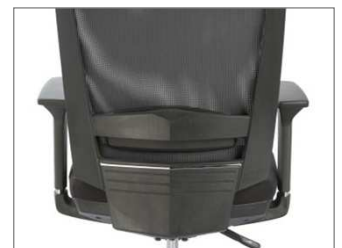
Soporte lumbar ajustable Adjustable lumbar support