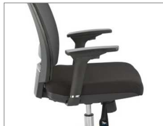
Reposabrazos ajustables Height adjustable armrests

2.- It is possible to adjust the height of the chair at different anthropometric characteristics. Please, contact with us for other available sizes.