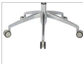
Base de aluminio pulido Polished aluminium base